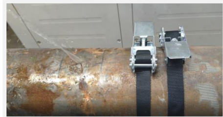
Instalar las correas de trinquete