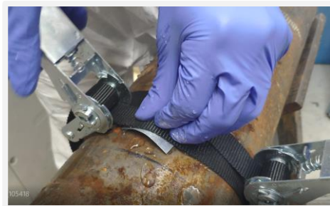
Colocar el masilla precurado sobre la fuga